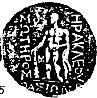
Pl.II. - Monede thasiene din tezaurul de la Mavrodin, jud. Teleorman.