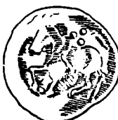
Monede dacice din tezaurul de la Periş, jud. ilfov