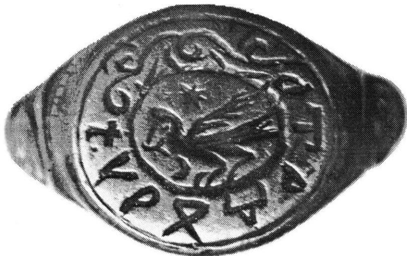
Inel sigilar descoperit în săpăturile arheologice efectuate la Lerești, județul Argeș, în 1966